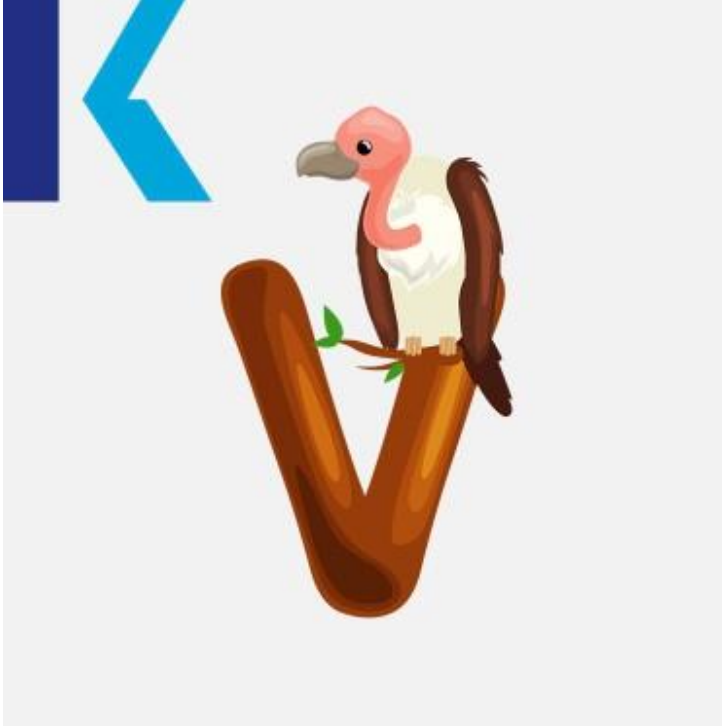
V - Vulture

لا يوجد حرف يشابه هذا الحرف في اللغة العربية لكنّه حرف سهل اللفظ ونجده في عدة كلماتٍ شائعة مثل very – كثيراً، five – خمسة.