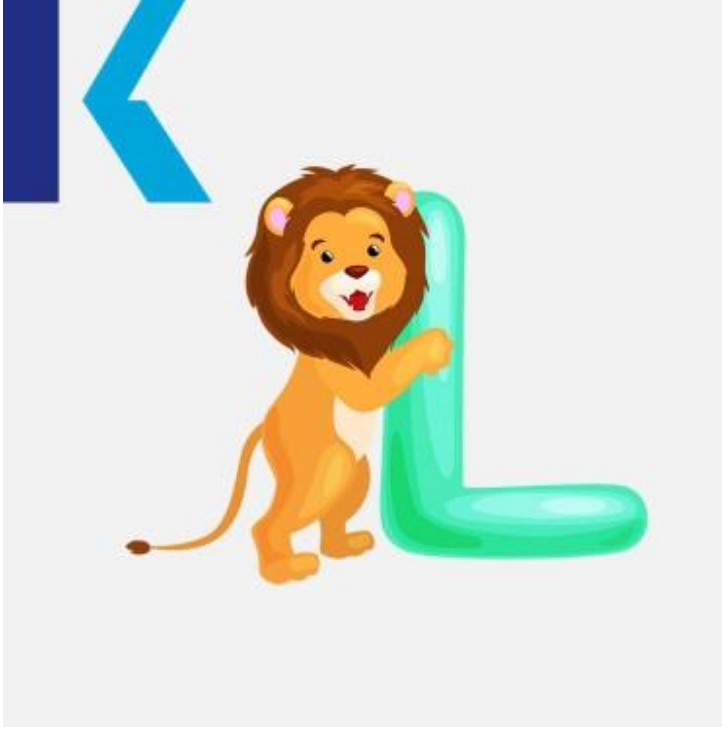
L - Lion

– Low: يُعبّر اسم هذا الحرف عن طريقة لفظه "إل" ونجده في العديد من الكلمات باللغة الإنجليزية مثل يكذب- lieمنخفض و