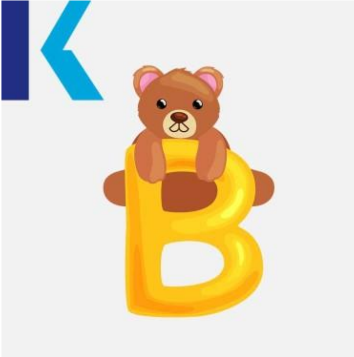
B - Bear

شرفة. لكننا لا نلفظه في بعض - balcony ،نحلة - bee : يلفظ هذا الحرف البسيط في معظم الكلمات شكّ أو - doubt : خروف. أو في كلماتٍ معيّنة مثل - lamb : مثل "m" الحالات التي يتبع فيها عادةً بـ دين - debt .