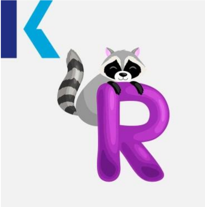
R - Raccoon

run – يماثل حرف "الأر" حرف الـ "ر" باللغة العربية ونجد العديد من الكلمات التي تحتوي عليه مثل جاف – dry يركض و