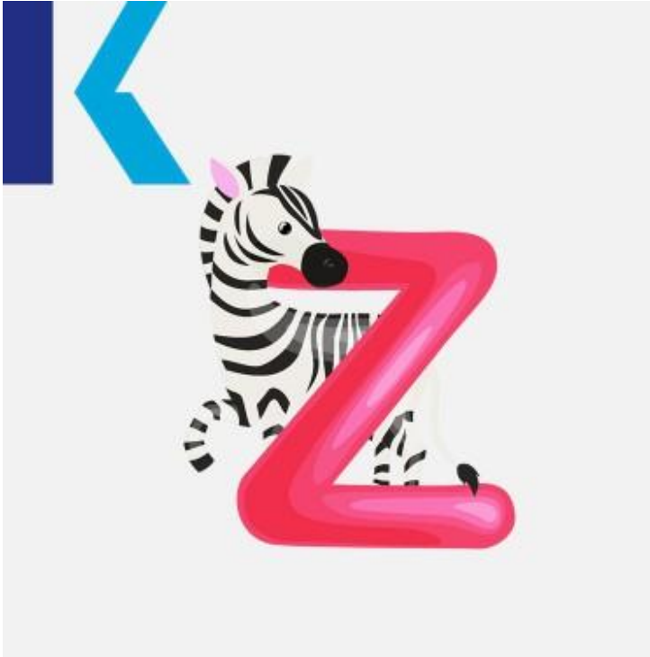
Z - Zebra

حديقة الحيوان – zoo : يلفظ هذا الحرف، حرف الـ "زد" مثل حرف "ز" في اللغة العربية.