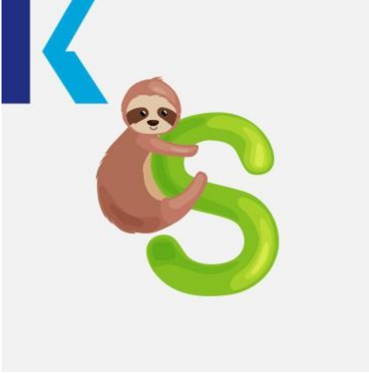
S - Sloth

يعتبر حرف الـ "إس" ثالث أشيع حرف ساكن من حيث الاستخدام باللغة الإنجليزية، ونجده كثيراً في بداية يوعده. يأتي كدلالة على الجمع في نهاية الأسماء مثل – promise ، يبدأ – start : ونهاية الأسماء أو الأفعال برتقال – oranges .