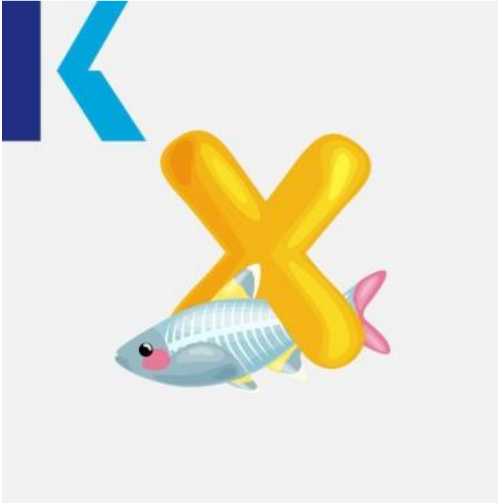
X - X-ray tetra

المكسيك – Mexico يشرح و – explain: يعتبر أشهر لفظ للحرف هو "إكس" مثل