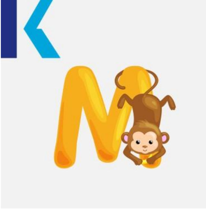
M - Monkey

يُشابه هذا الحرف حرف الـ "م" في اللغة العربية. ويُعتبر من أبسط الأحرف لفظاً في اللغة الإنجليزية. نجده ملكي - my، أم - mother: في العديد من الكلمات مثل