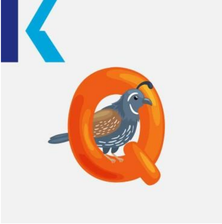
Q - Quail

"u" في اللغة الإنجليزية وعادةً ما يأتي متبوعاً بحرف "Z" يُعتبر هذا الحرف الأقل استخداماً بعد حرف يترك - quit يحصل و - acquire: كما في