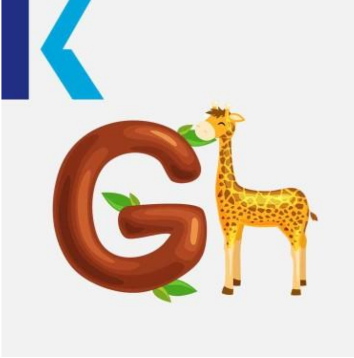
G - Giraffe

يعتمد لفظ هذا الحرف في معظم الحالات على الحرف الذي يتبعه على الشكل التالي: