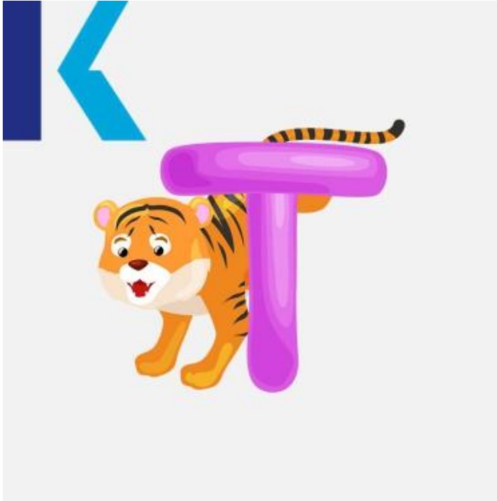
T - Tiger

tea يشابه حرف الـ "تي" حرف الـ "ت" باللغة العربية ونجده في الكثير من الكلمات باللغة الإنجليزية مثل ربطة عنق – tie، شاي-