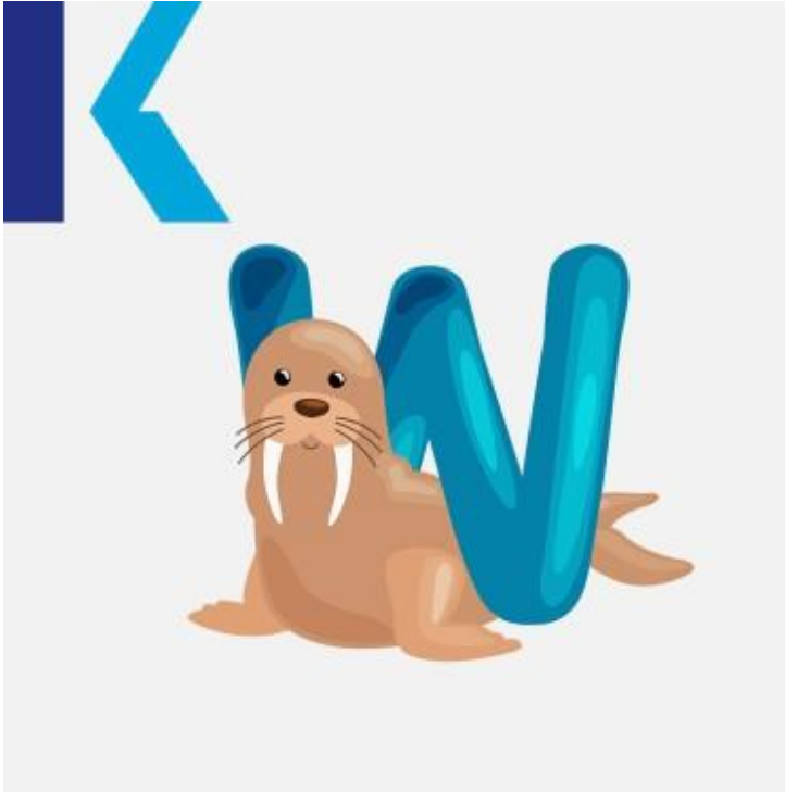
W - Walrus

يتمنى – wish: يلفظ حرف الـ"دبليو" مثل لفظ حرف الـ"و" في اللغة العربية في معظم الحالات مثل يعمل – work و