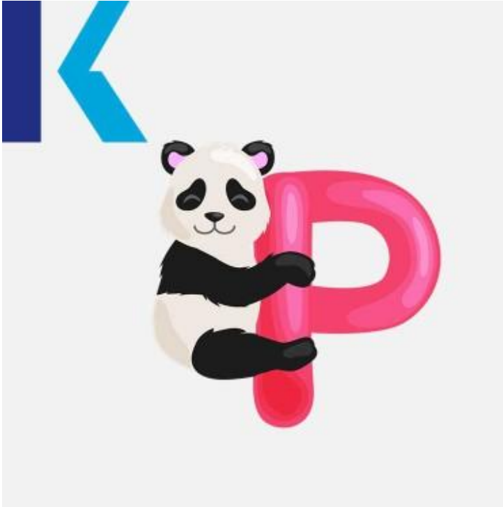
P - Panda

يمكنك لفظ هذا الحرف بالطريقة الصحيحة فقط إذا قمت بإطباق شفثيك على بعضهما وزفرت بعض الهواء يضع – putتفاحة و – apple: وأنت تقول "بيه". من الأمثلة عليه