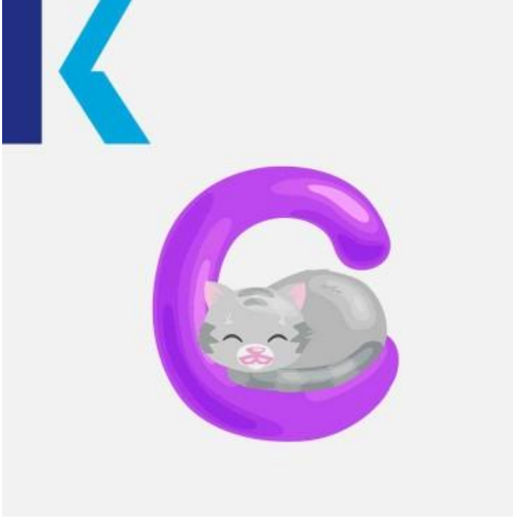
C - Cat

"y"، "e" يكون لفظ هذا الحرف عادةً مشابهاً لحرف الـ "س" باللغة العربية إذا تُبعت بالأحرف الصوتية فاخر – fancy، سلام – و peace: مثل "i" و