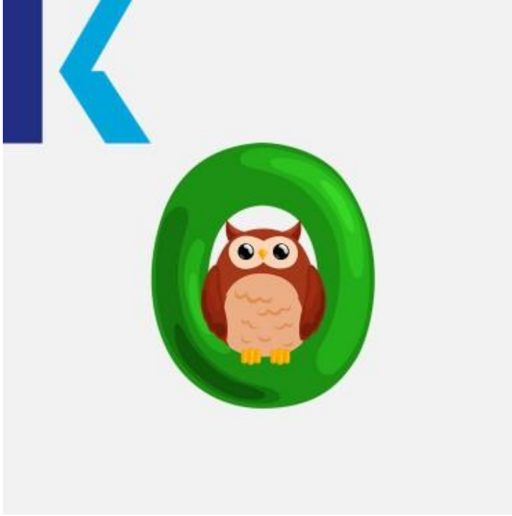
O - Owl

يعتبر هذا الحرف السهل رابع أكثر حرف استخداماً من الحروف الإنجليزية ، ويمتلك – كما بقية الأحرف الصوتية باللغة الإنجليزية – لفظاً طويلاً ولفظاً قصيراً.