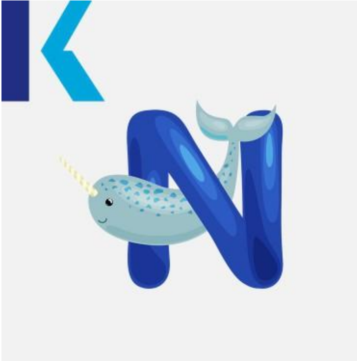
N - Narwhal

Now – يعبر هذا الحرف عن اللفظ نفسه الذي يعبر عنه حرف الـ "ن" باللغة العربية. ومن الأمثلة عليه في الأسفل – down، الآن.