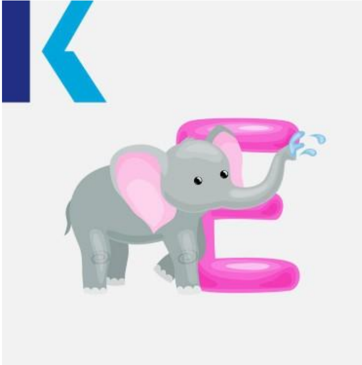
E - Elephant

يسمى هذا الحرف بحرف الـ [إي]. يعدّ من أكثر الأحرف تكراراً في اللغة الإنجليزية، ولعلّه من أكثر الأحرف التي تأتي مجتمعةً مع الحرف السابق لتشكل ثنائية لها لفظ معيّن.