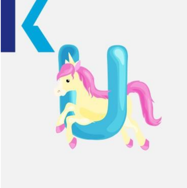
U - Unicorn

يمتلك هذا الحرف الصوتي عدة طرقٍ للفظ بحسب ما يتبعه من الأحرف في الكلمة.