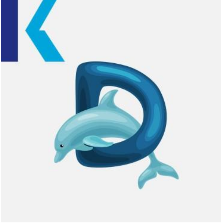
D - Dolphin

بطة – duck: يعتبر هذا الحرف من أبسط الحروف، حيث يلفظ مثل اسمه تماماً كما في الكلمات التالية أسفل – down