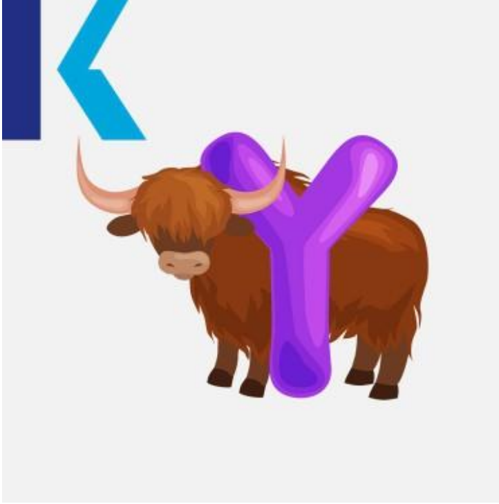
Y - Yak