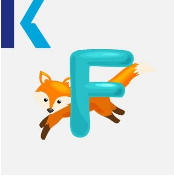
F - Fox

عرض - offer حقيقة و - Fact: يُلفظ هذا الحرف كاسمه "ف" أيضاً