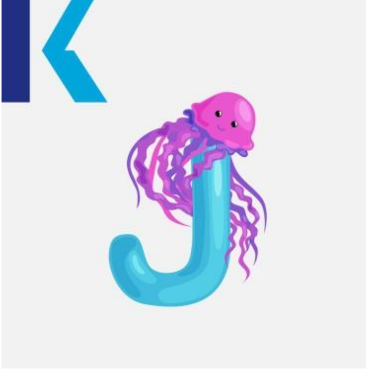
J - Jellyfish

طائرة نفاثة – jet فهد أو – jaguar: يلفظ هذا الحرف مثل اسمه تماماً "جيه" كما في الأمثلة التالية.